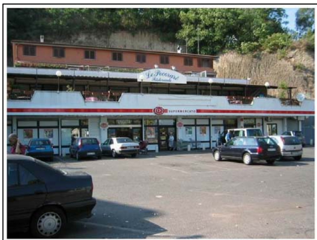
Via Tiberina – Castel Nuovo di Porto (Rm)

Immobile di Via Tiberina, km 14,5 – Castel Nuovo di Porto (Rm)