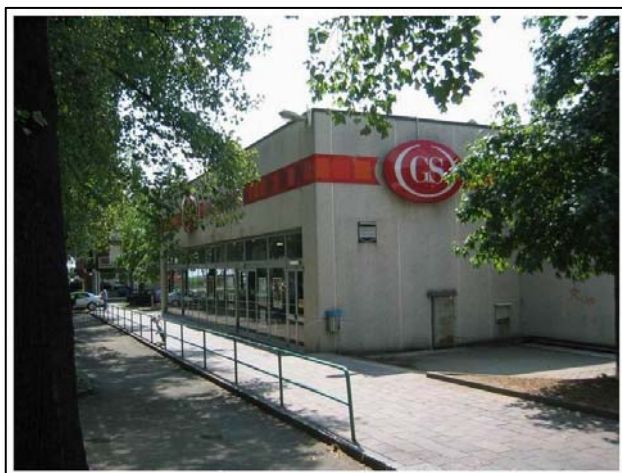
Corso Europa - Biella