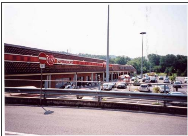
Via Dante – Barzago (Lc)