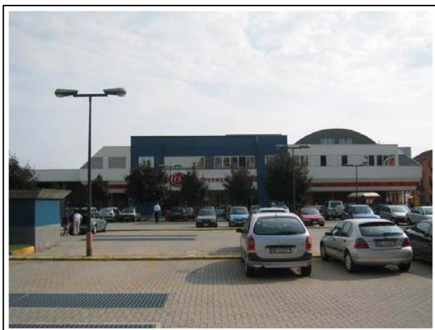
Via Gniffetti - Novara

Immobile di Via Gniffetti, 74/76/80 - Novara