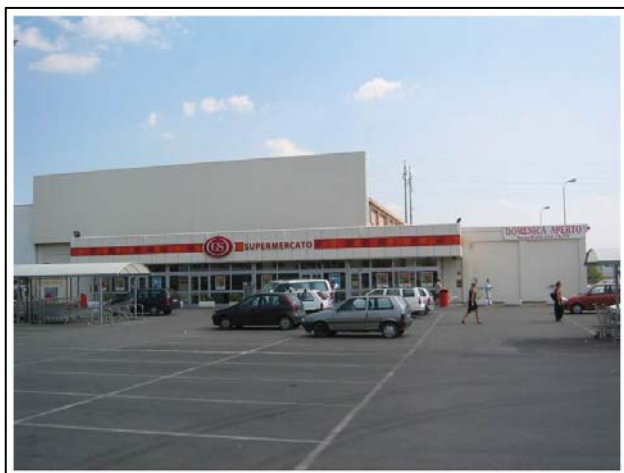
Via Tiburtina – Tivoli (Rm)