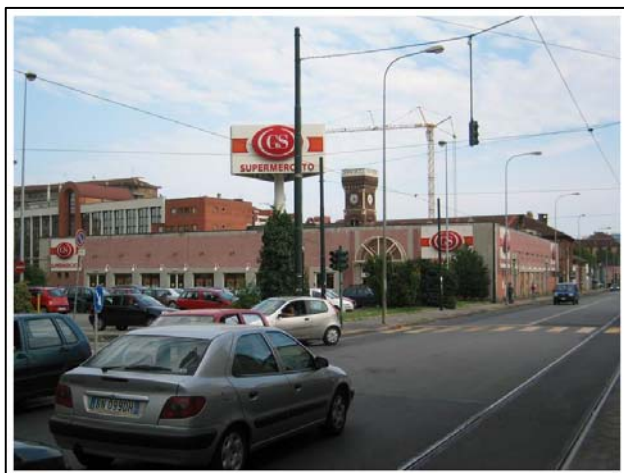
Via Stradella - Torino