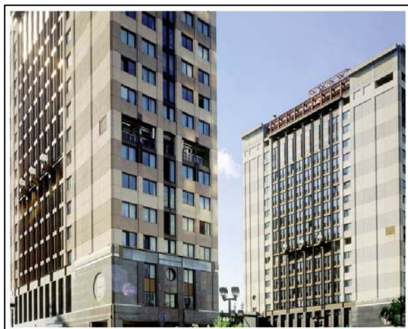
Palazzi A4 e B1 – V.le Calamandrei (Na)