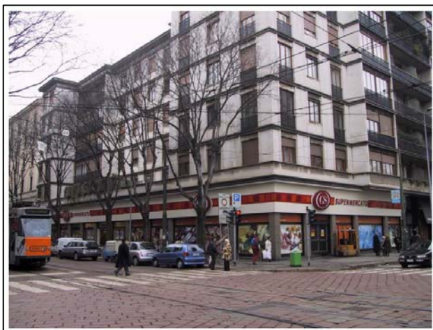
Via Monti (Mi)