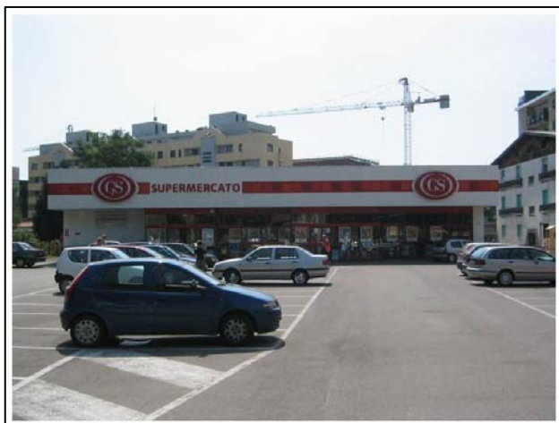
Via 1° Maggio – Saronno (Va)