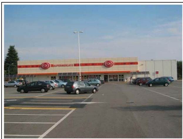
Via Pionieri dell'Aria - Legnano (Mi)