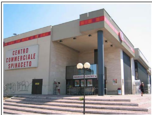
Spinaceto - Roma

Immobile di Via degli Eroi di Rodi, 8/16 – Roma (loc. Spinaceto)