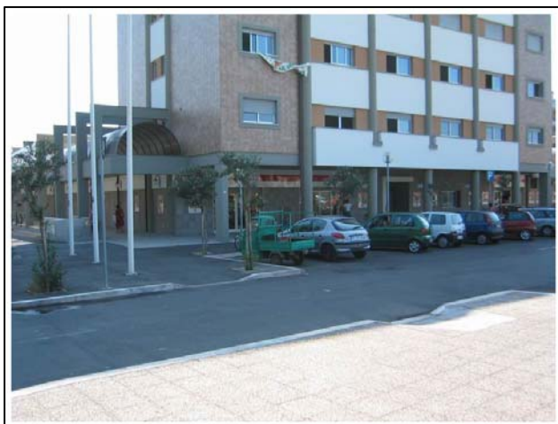
Via Diaz – Nettuno (Rm)