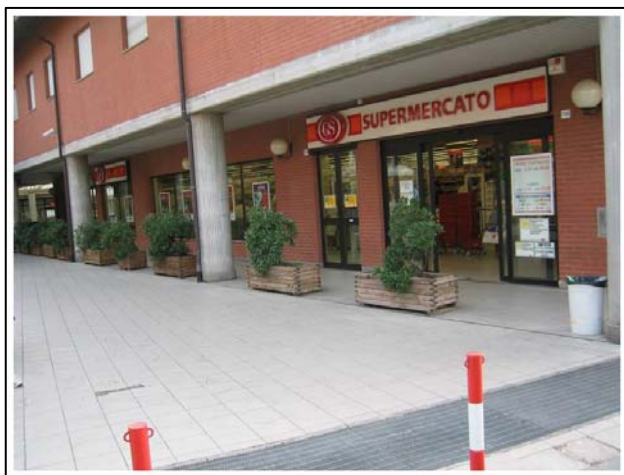
Via Spanna – Grugliasco (To)

Immobile di Via Spanna, 3/16 – Grugliasco (To)