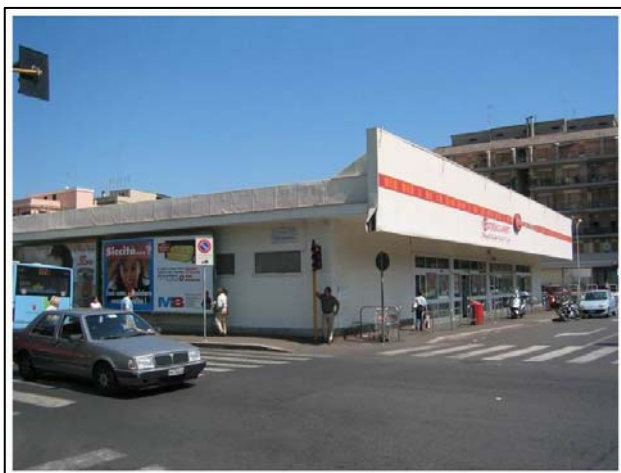
Via Casilina - Roma

Immobile di Via Casilina, 995 A e B - Roma