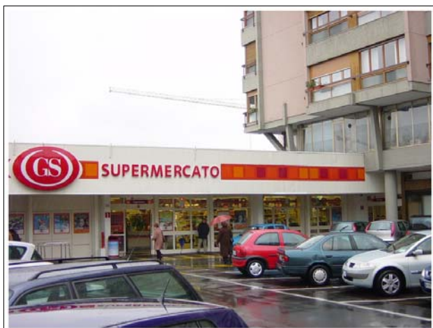
Via Duca D'Aosta – Busto Arsizio (Va)

Immobile di Via Duca D'Aosta, 19 – Busto Arsizio (Va)