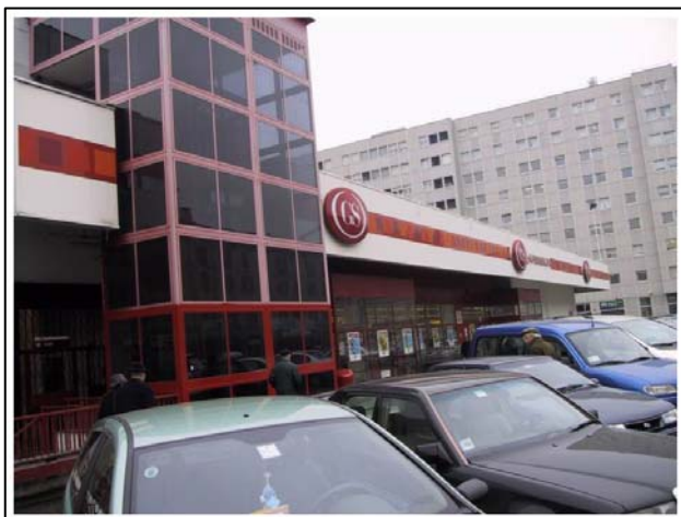
Via Farini (Mi)