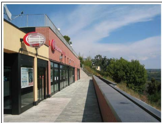
Piazza Vittorio Veneto – Fossano (To)