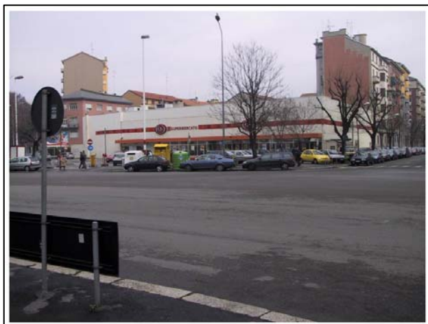
Piazza Siena (Mi)