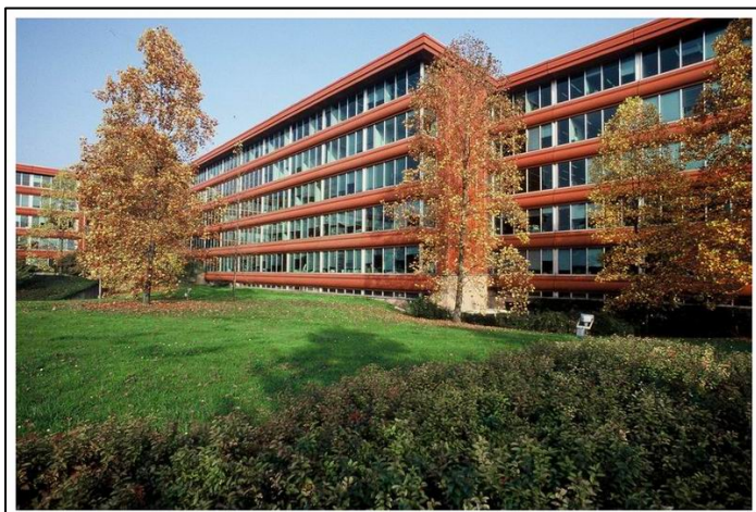
3° Palazzo Uffici

Immobile di Viale De Gasperi, 16 – San Donato Milanese (Mi)