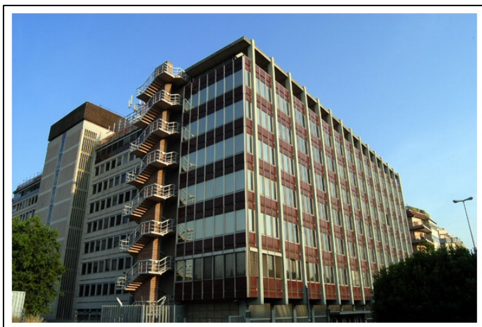
Prospetto su via Cristoforo Colombo

Immobile di Via Cristoforo Colombo, 142 – Roma