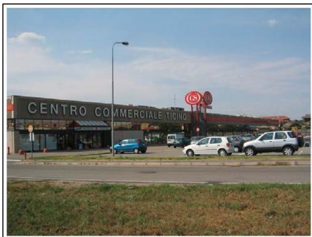
Via delle Allodole – Busto Arsizio (Va)