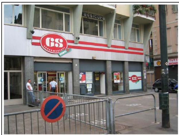
Via Monginevro - Torino