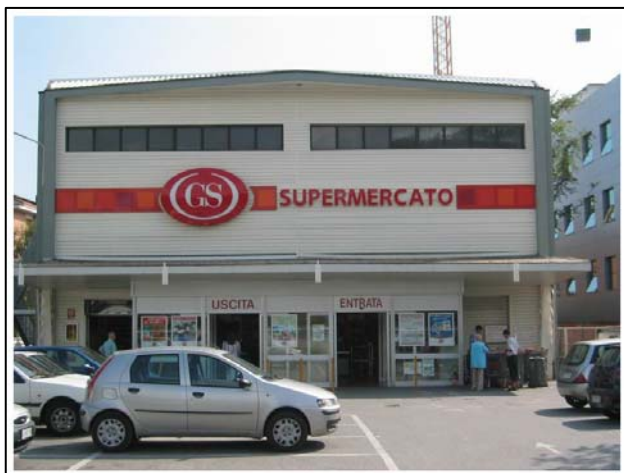
Via Circonvallazione – Ivrea (To)

Immobile di Via Circonvallazione, 54 – Ivrea (To)