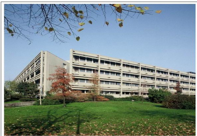
4° Palazzo Uffici

Immobile di Martiri di Cefalonia, 67 – San Donato Milanese (MI)